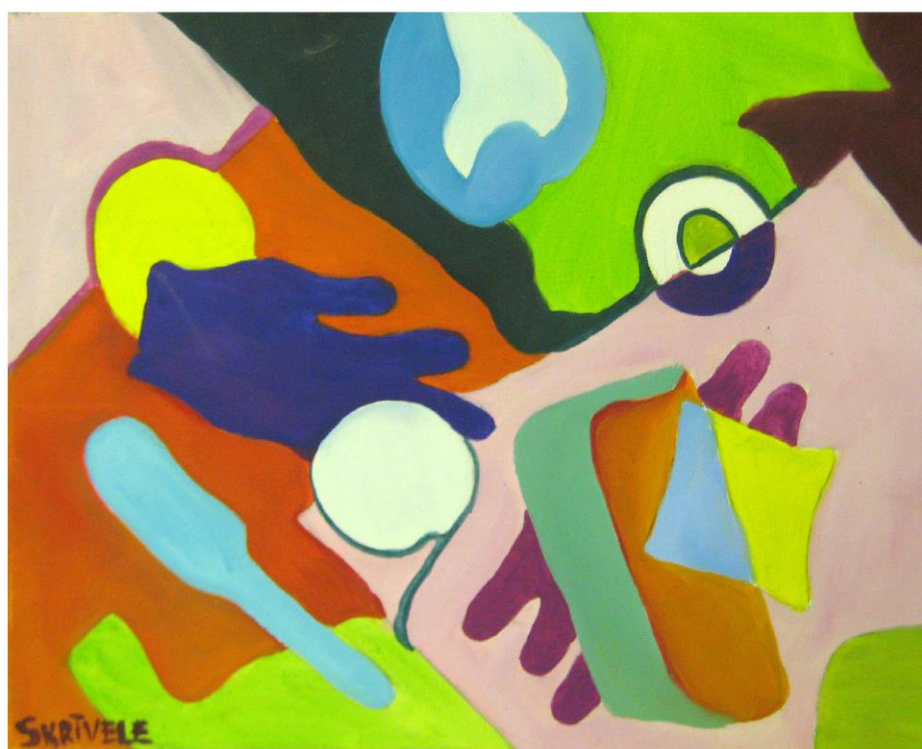
Laima Skrīvele; Noela Valdovska 1. c kurss 2016 Klusā daba (izteiksmes līdzeklis- līnija, laukums) k/e